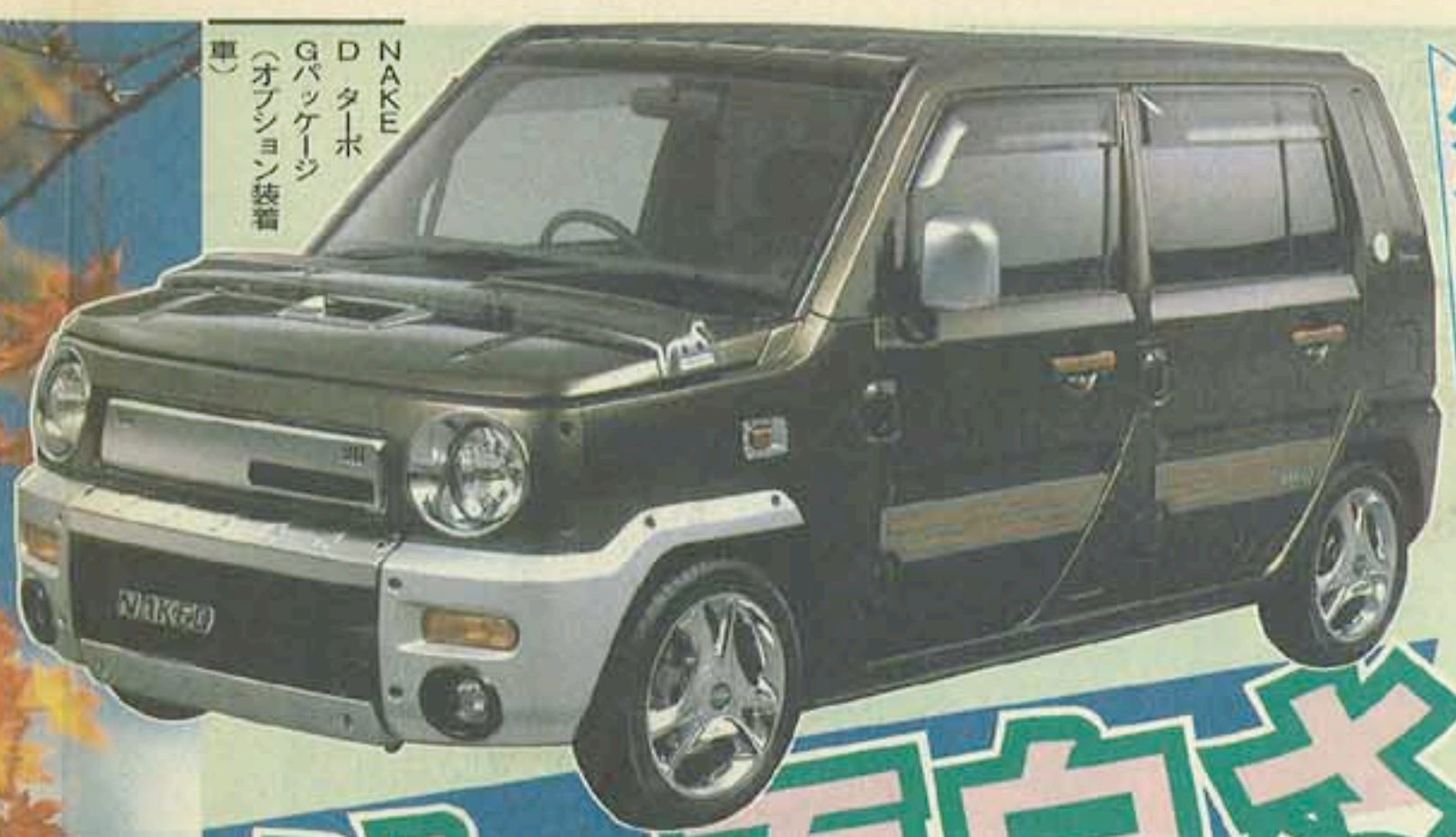
NAKED D ターボ G パッケージ (オプション装備)