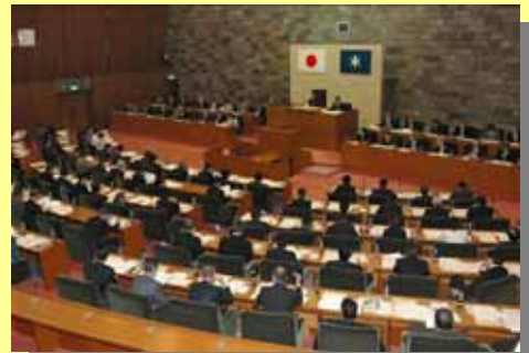
10月11日、千葉県議会は全会一致で条例案を可決